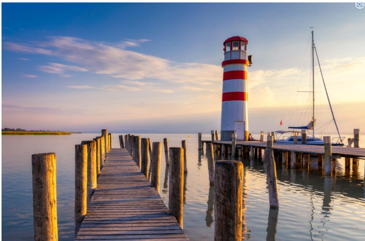
Pátfalu (Podersdorf am See)

Idén április és augusztus között szombat-vasárnaponként közlekedik Sopron és az ausztriai Neusiedl am See között a GYSEV Zrt. Fertő-táj vonatjárata.