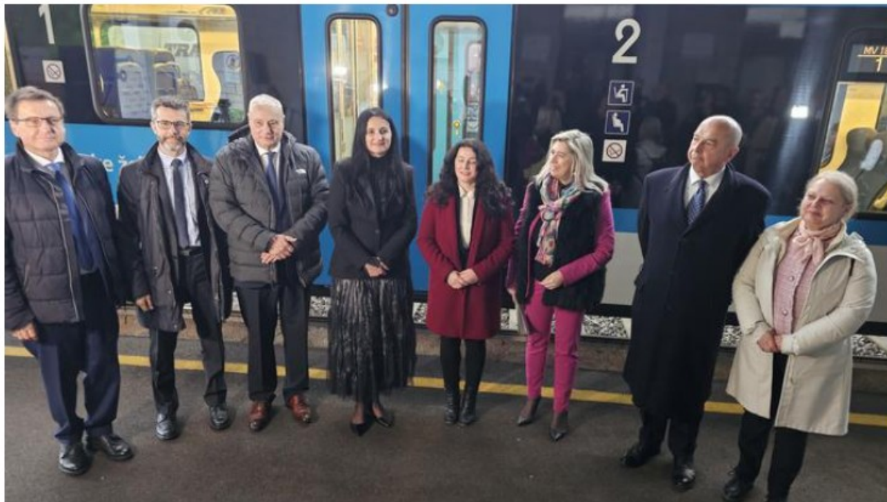
Simbolno rezanje traku na openski železniški postaji

Nova železniška povezava je namenjena krepitvi trajnostnih čezmejnih povezav in spodbujanju uporabe javnega prevoza v turistične namene ter je del evropskega projekta Sustance v okviru programa Interreg Srednja Evropa.