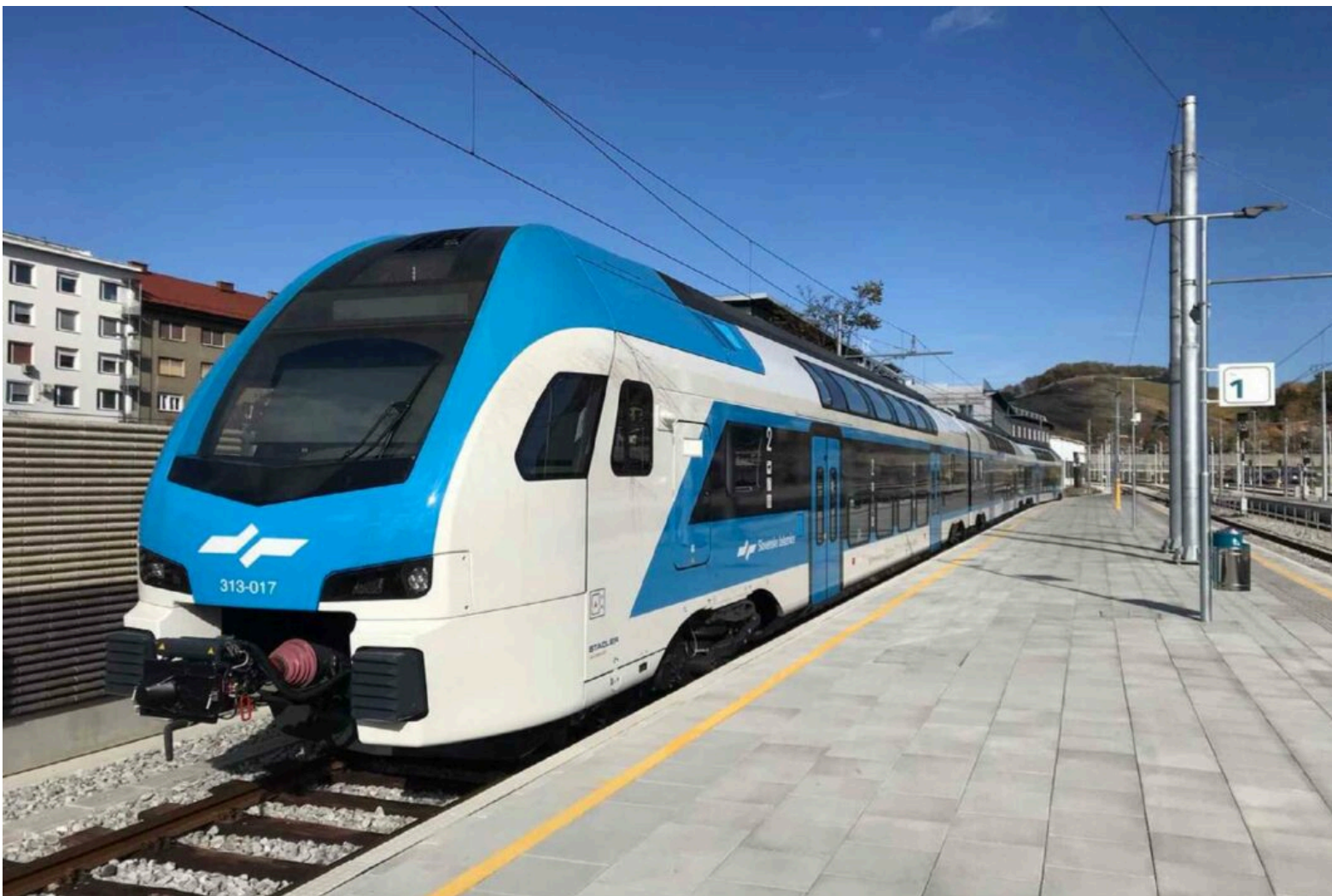
Immagine di repertorio

27.03.2024 – 10.00 – Partirà tra un mese, il 24 aprile , il nuovo servizio ferroviario da Trieste a Fiume/Rijeka . Uno sforzo congiunto frutto di una collaborazione transfrontaliera tra il Segretariato Esecutivo dell'InCE (Iniziativa Centro Europea), le ferrovie italiane, slovene e croate. Un nuovo servizio ferroviario sperimentale sotto l'egida dell'Unione Europea. Si tratterà di un treno sloveno Stadler, gestito da personale sloveno e croato. Sebbene l'accezione 'Trieste' sia forse un po' ingannevole; non si partirà infatti dalla stazione di Piazza della Libertà, ma da Villa Opicina . La partenza è prevista tutti i giorni, dalle ore 7:50 , con arrivo a Fiume alle 09:54 e ritorno dalla città fiumana alle 18:25 e arrivo a Villa Opicina alle 20.40 . Il collegamento ferroviario rimarrà operativo fino al 30 settembre . Accanto alle 'classiche' biglietterie, sarà possibile acquistare i ticket direttamente in contanti sul