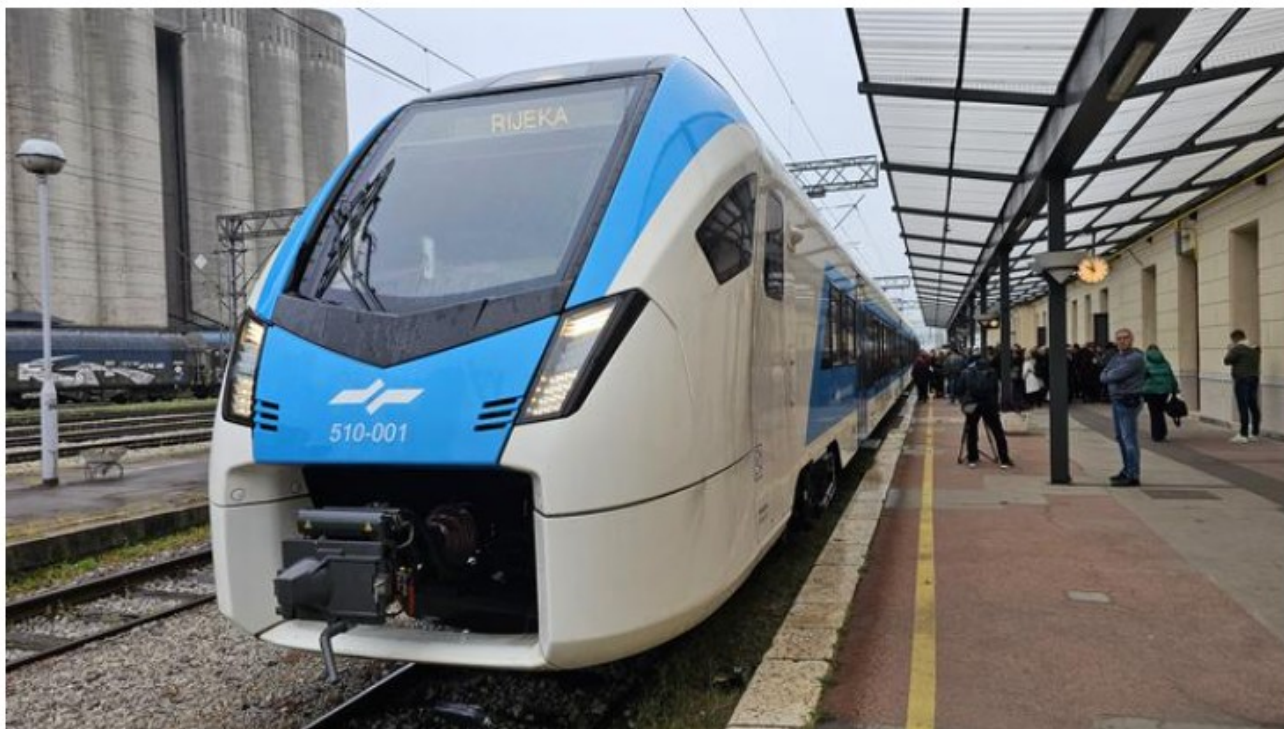
Prvi prihod potniškega vlaka iz Opčin na reški železniški kolodvor