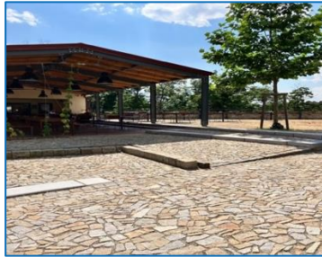
Foto 3 - Gastgarten - Ausstattung