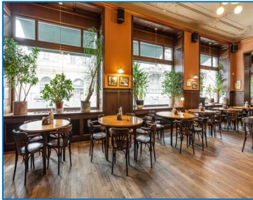
Foto 2 - Gastgarten - Eintritt