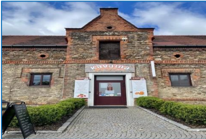
Foto 2 - barrierefreier Eingang