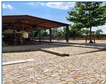
Foto 3 - zahrádka posezení