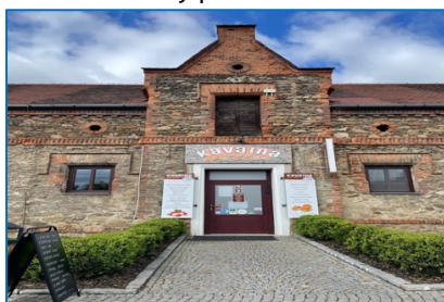
Foto 2 - bezbariérový vstup